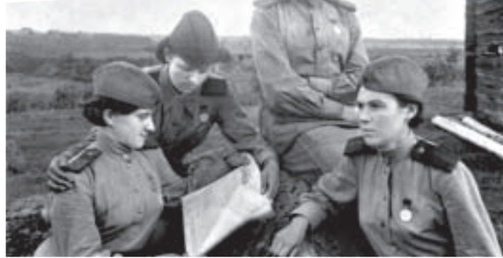
На нижнем фото она сверху.

Потомкам: Берегите Родину! Это, кроме близких и родных, самое святое.